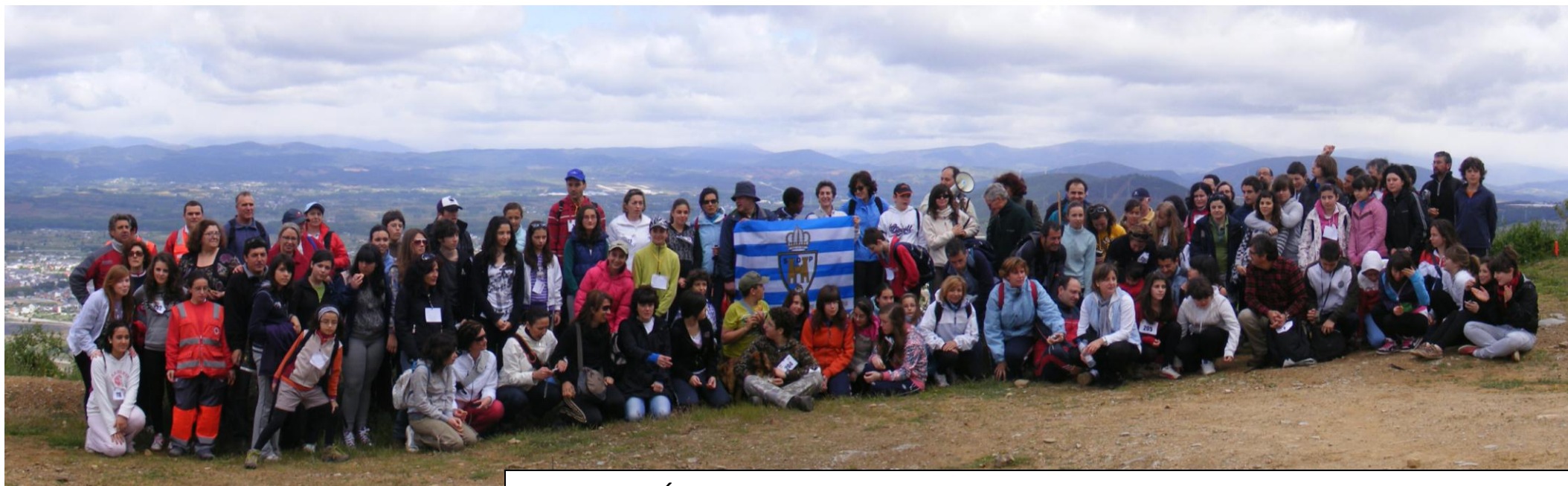
I EDICIÓN MARCHA SOLIDARIA - MONTE PAJARIEL - 15 - MAYO - 2010