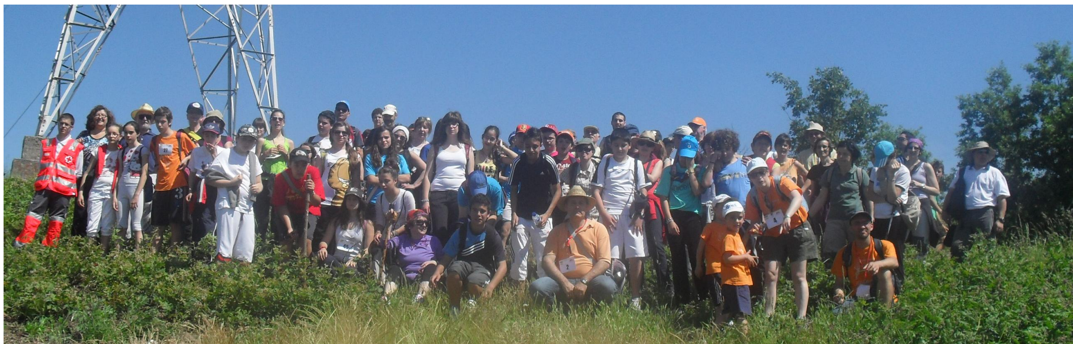
II EDICIÓN MARCHA SOLIDARIA - ENTRE CASTROS - 21 - MAYO - 2011