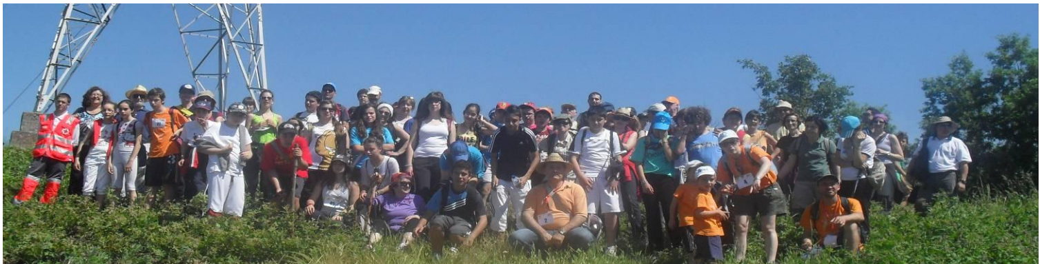
II EDICIÓN MARCHA SOLIDARIA - ENTRE CASTROS - 21 - MAYO - 2011