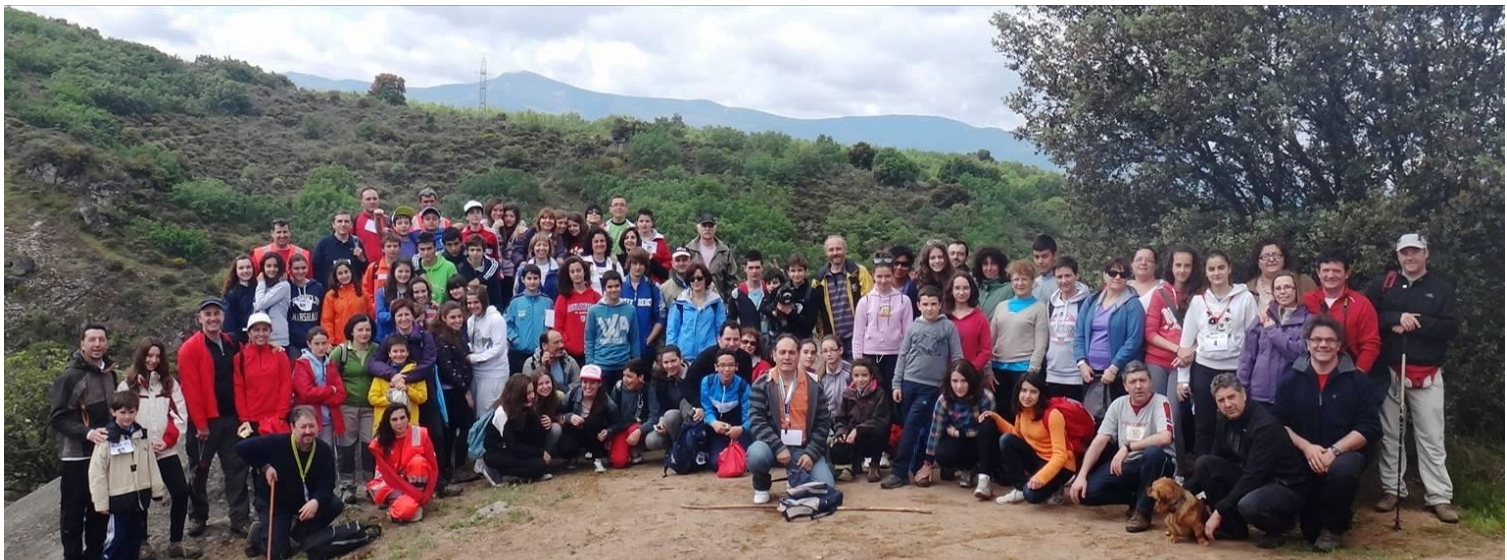
III EDICIÓN MARCHA SOLIDARIA - RUTA LOS CANTEROS - 16 - MAYO - 2012