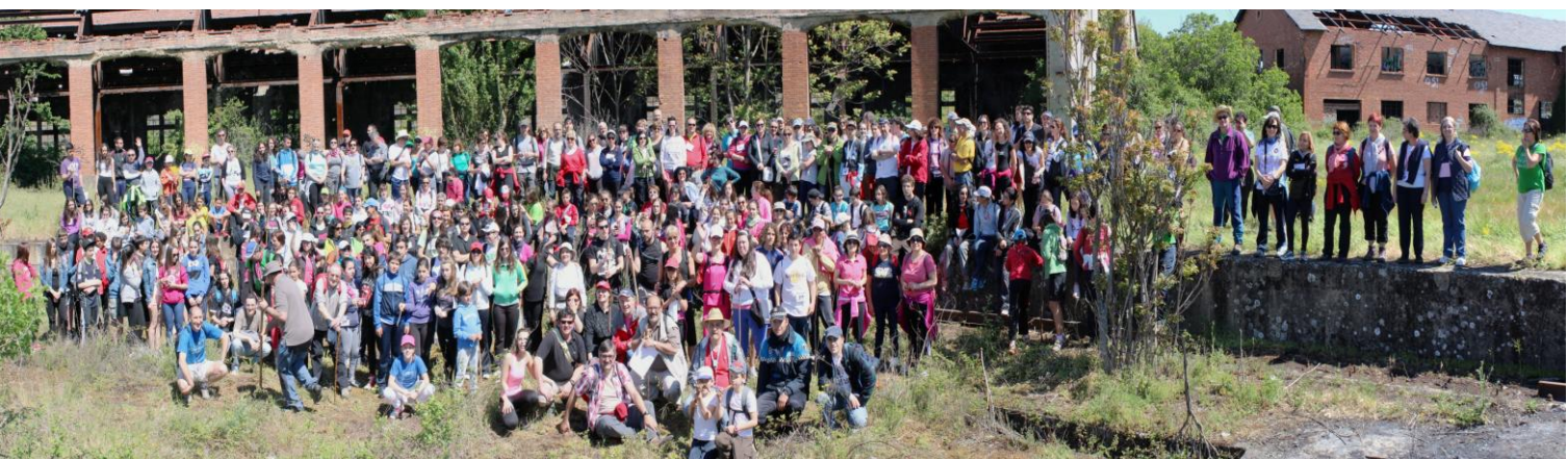
IV EDICIÓN MARCHA SOLIDARIA - RUTA URBANA - 11 - MAYO - 2013