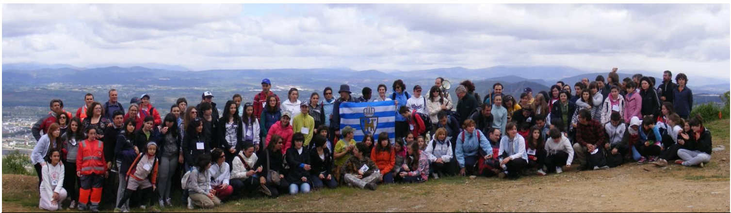
I EDICIÓN MARCHA SOLIDARIA - MONTE PAJARIEL - 15 - MAYO - 2010