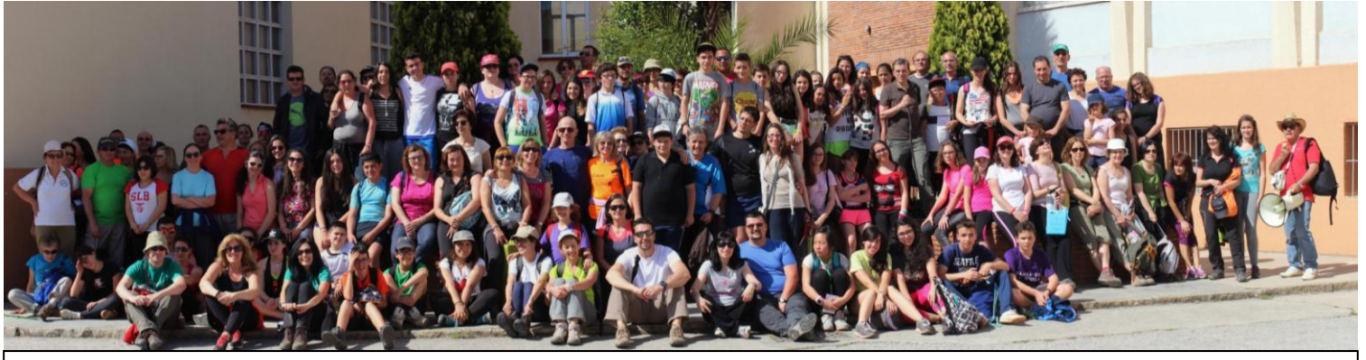
V EDICIÓN MARCHA SOLIDARIA - LAS MÉDULAS - 17 - MAYO - 2014