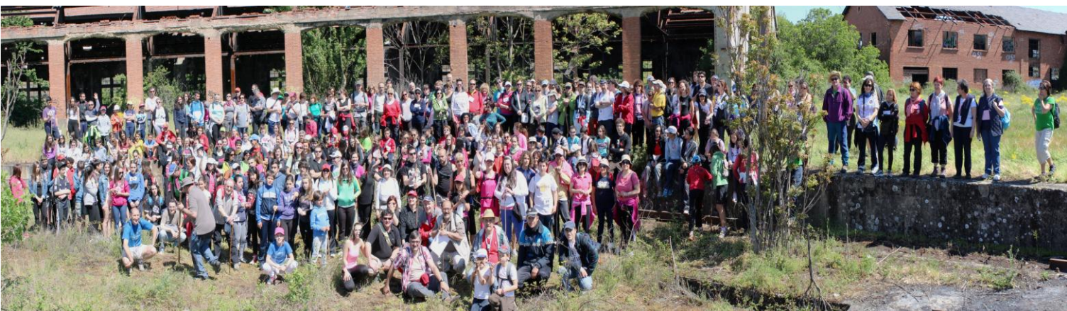
IV EDICIÓN MARCHA SOLIDARIA - RUTA URBANA - 11 - MAYO - 2013