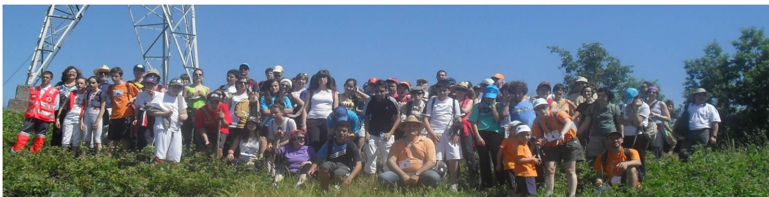
II EDICIÓN MARCHA SOLIDARIA - ENTRE CASTROS - 21 - MAYO - 2011