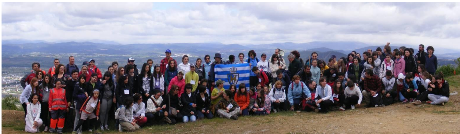
I EDICIÓN MARCHA SOLIDARIA - MONTE PAJARIEL - 15 - MAYO - 2010