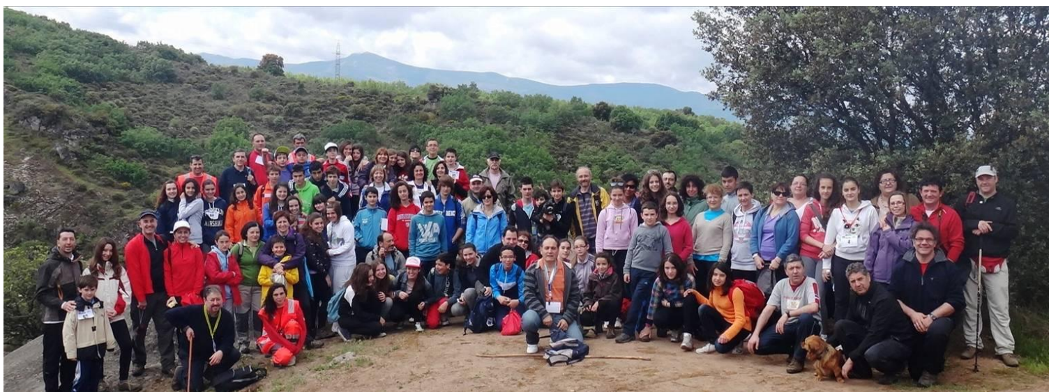
III EDICIÓN MARCHA SOLIDARIA - RUTA LOS CANTEROS - 16 - MAYO - 2012